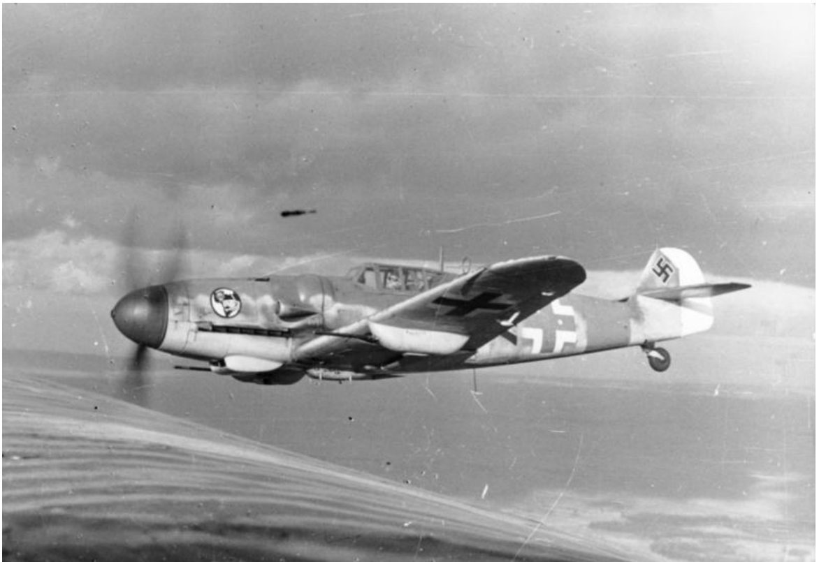
.Obr. 5 Messerschmidt BF-109