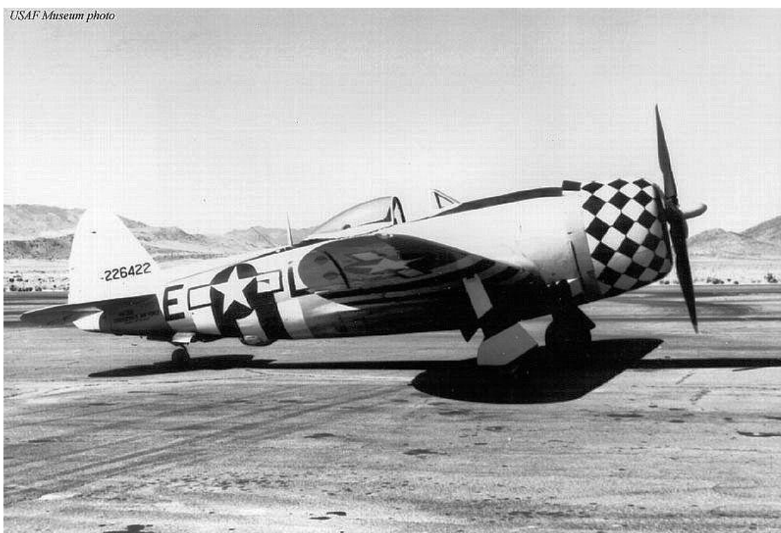
Obr. 4 P-47 Thunderbolt