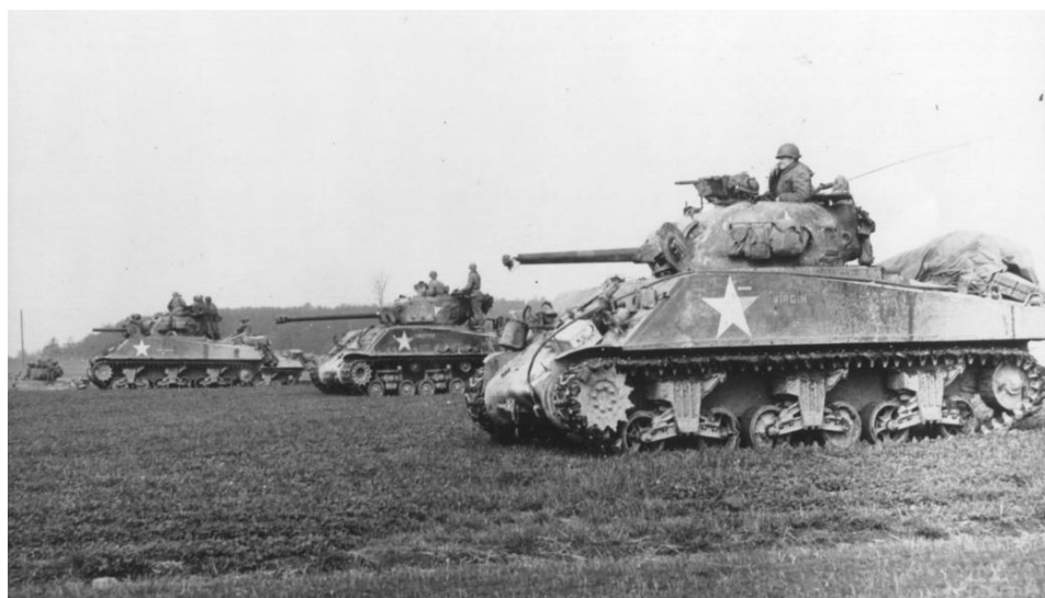
Obr. 3 M4A3 Sherman