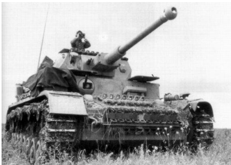
Obr. 6 Pzkw IV