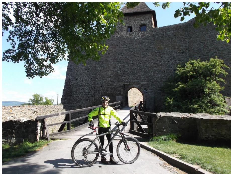
Obr. 2 Vstupní most a brána hradu Helfštýna.

Byla pěkná slunná sobota 10. května 2014, a tak jsme se rozhodli s kamarádem Karlem vyjet na Helfštýn. Naše cesta začala u Dolního rybníka ve Velkém Újezdě. Většinu cesty jsme jeli po hrbolaté asfaltové cestě, která vede přes Veselíčko až do Lipníka nad Bečvou, kde začíná cyklostezka Bečva, díky které jsme dojeli až do Týna nad Bečvou. Z Týna jsme stoupali k samotnému Helfštýnu. Domů jsme se vrátili kolem půl jedné, téměř po 42 kilometrech jízdy.