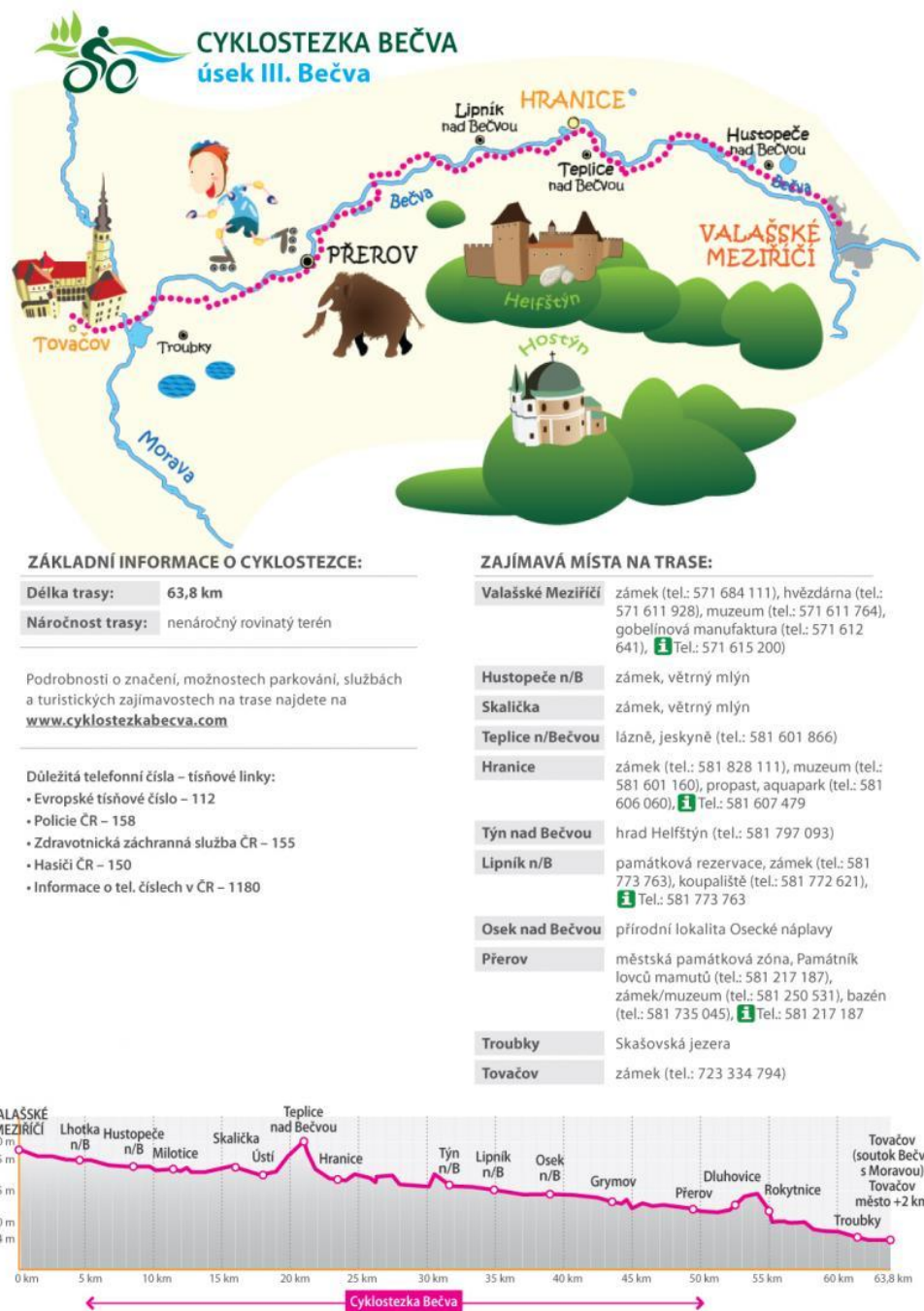
Obr. 3 Cyklostezka Bečva.

Na trase jsme využili III. část cyklostezky Bečva, po které se velmi pohodlně jede a která má výborné značení.