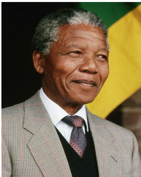
Nelson Mandela v období prezidenta JAR

„Nikdo se nenarodí s nenávisť ke druhé osobě kvůli barvě její kůže, její minulosti nebo jejímu náboženství. Lidé se musí nenávisť naučit, a jestliže se mohou naučit nenávidět, lze je také učit lásce, protože láska je lidskému srdci přirozenější než její opak.“