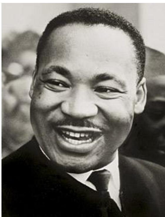
Martin Luther King

„Nejhorší ze všech tragédií není zemřít mladý, nýbrž žít do pětasedmdesáti, a přece nikdy nežít doopravdy.“