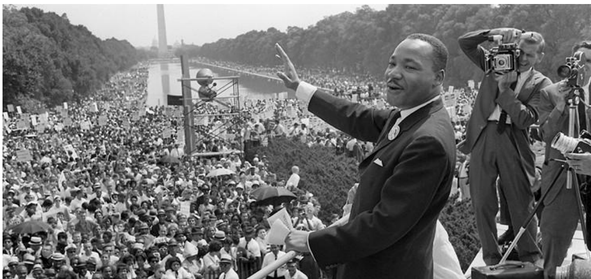
King na největším protestu USA