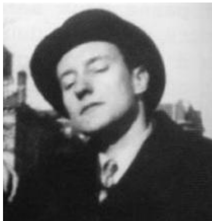
Obr. 8 William S. Burroughs

V tomto díle používá halucinogenní styl postavený na „číslech“ a stříhové metodě.