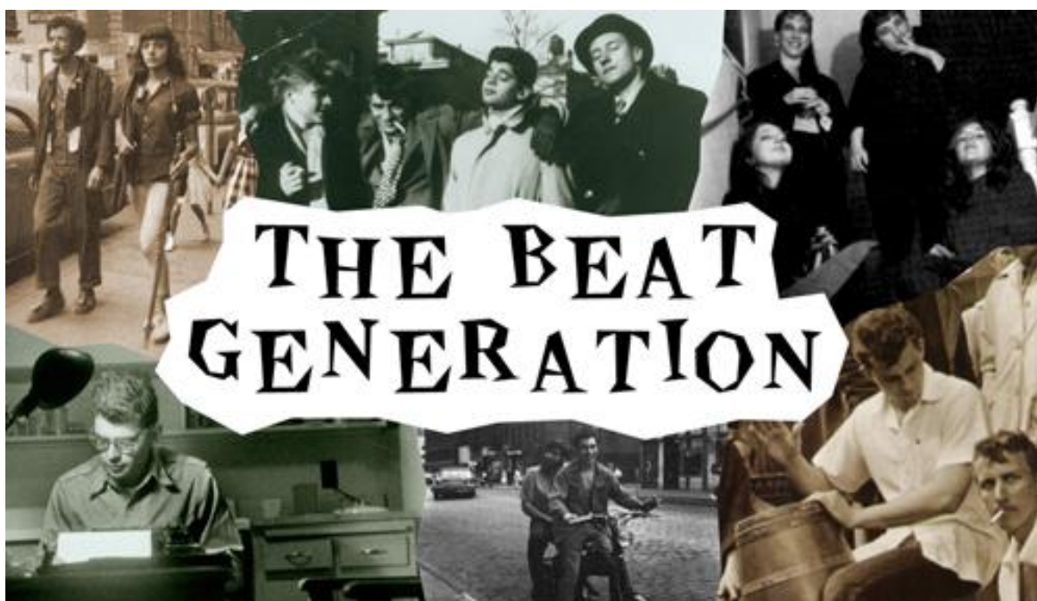
Obr. 1 Plakát beatové generace