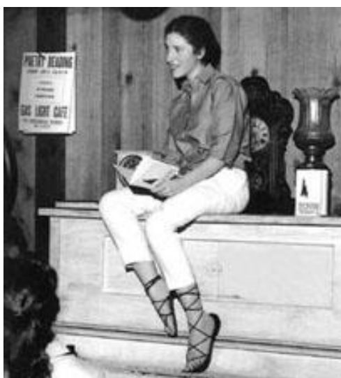
Obr. 9 Diane di Prima