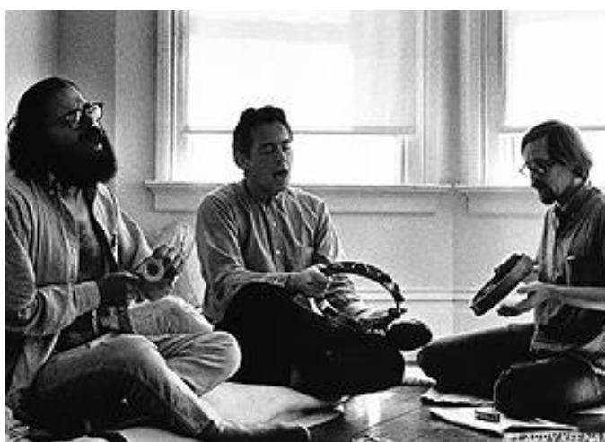
Obr.2 Básníci v Six Gallery

Byla zde též dnes již proslulá Six Gallery , kde 6 beatnických básníků (Philip Lamantia, Michael McClure, Allen Ginsberg, Gary Snyder, Phil Whalen, Kenneth Rexroth, a Jack Kerouac) pořádalo svá autorská čtení a performance.