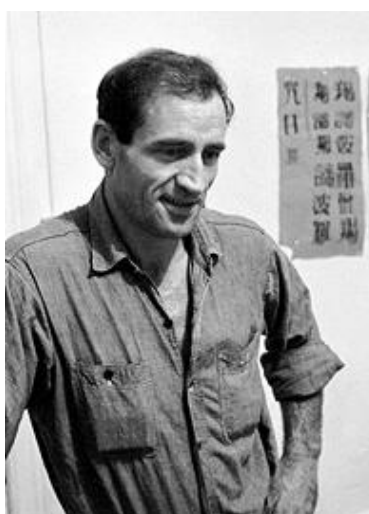
Obr.6 Neal Cassady

Psal prózu i poezii a za jeho života mu žádná kniha nevyšla, a tak z jeho psané tvorby zůstalo velmi málo. Kniha První třetina (1971) je to jediné, co zbylo z jeho neustále ztrácené a nalézané autobiografie. V roce 1993 vyšla kniha Půvab beatové karmy: Dopisy z vězení a v roce 2004 Neal Cassady: Sebrané dopisy, 1944 – 1967 .