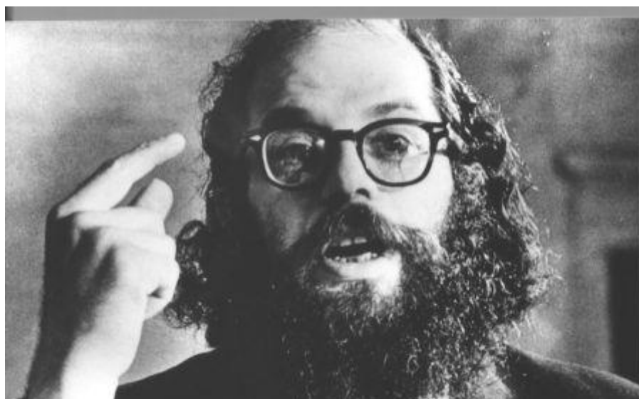
Obr. 7 Allen Ginsberg