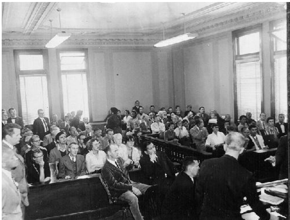
Obr 3. Soud „obscénního“ Kvílení

Beatnici představovali nové literární techniky a dávali na odiv svou hrubou sílu a drsnou osobnost. Používali řeč zahrnující obscenitu i humor, ideologicky rezonující se silami typu buddhismu či surrealismu a fungující na takové ideji normálnosti, jež byla v zásadě zcela odlišná od těch, které zastávali jejich kritici.