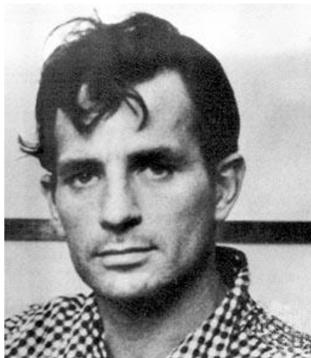
Obr.5 Jack Kerouac