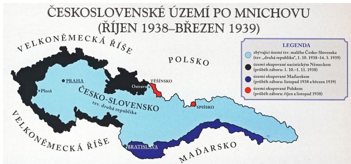
Obr. 3 Československo po Mnichovské dohodě