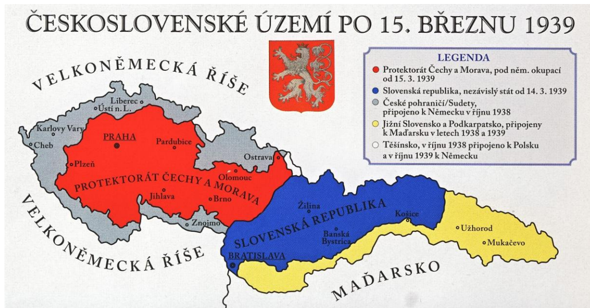
Obr. 4 Území Československa od 15. března 1939