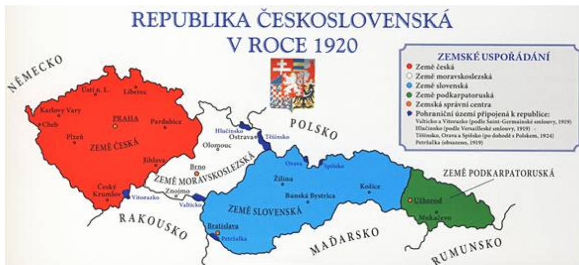
Obr. 1 Československo v roce 1920

Slovenská inteligence a krajanské spolky v USA vznik Československa velmi vítaly. O to více byli zklamáni státoprávním uspořádáním, již 14. listopadu 1918 parlament zrušil slovenskou vládu. Namísto ní jmenoval pouze ministra pro Slovensko. V Pittsburské a Filadelfské dohodě byla také slibována autonomie pro Slovensko a Podkarpatskou Rus, ale nedočkali se jí. Nový stát si tak i v případě Slovenska vytvořil budoucí národnostní problém.